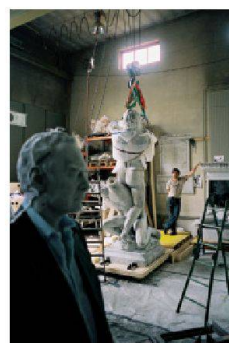
Une œuvre d'Urs Fischer pour la Biennale de Venise en production au Sitterwerk