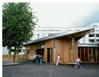
Salle de classe à l'école du Haut-Bois

Bâtir pour une éducation en extérieur Laila Wernli