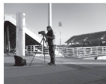
La série Game Over a été réalisée en juillet 2010, dans les principaux sites olympiques d'Athènes. Jürgen Nefzger a utilisé une chambre 20 x 25.