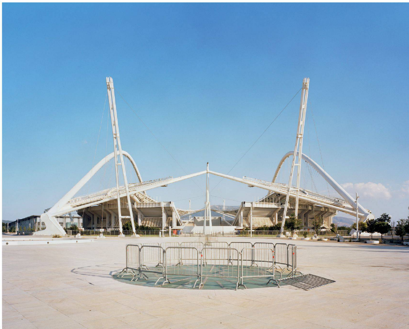
Fig. 14 : Le stade olympique fait partie du complexe olympique d'Athènes. Situé dans le quartier de Maroussi à Athènes, c'est le principal stade d'athlétisme des Jeux de 2004.