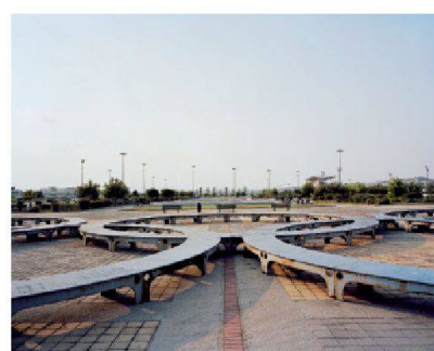
Les cerdes olympiques roullés

Athènes, l'émergence de la ville post-fordiste Yorgos Tzirtzilakis