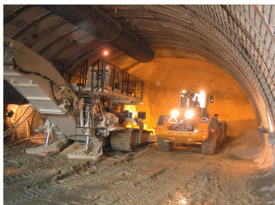
A 5 - Tunnel de Serrières (Neuchâtel NE)