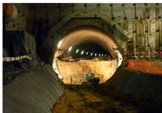
A 16 - Tunnel Sous le Mont (Tavannes BE)