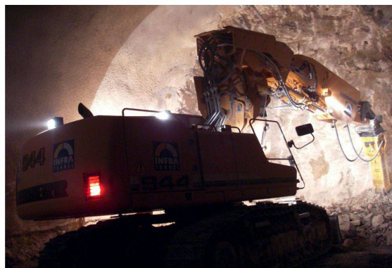
CFF - Tunnel du Mormont (Bavois VD)