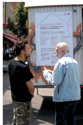
Démarche participative à Lausanne