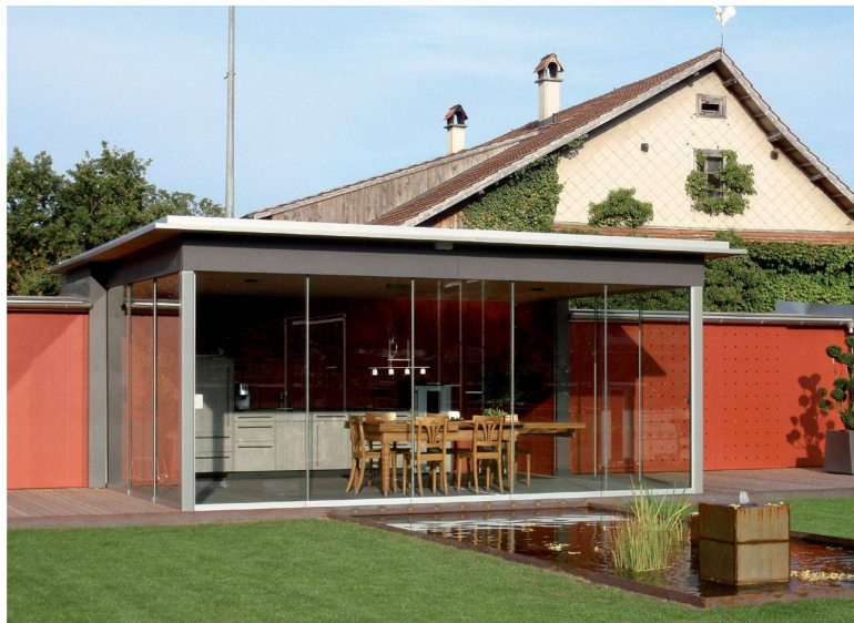
Profilés en aluminium. Montage facile et rapide. Paroi coulissante en verre plein VG15 avec ESG 8 +10 mm.