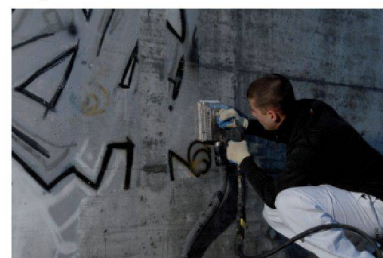
Desax SA CH - 1024 Ecublens < www.desax.ch >

cialisée depuis des années dans la protection anti-graffitis. La protection appliquée par des experts est transparente et donc invisible. Les gribouillages ne peuvent pas être évités entièrement, mais la surface est protégée contre les dommages. Les mêmes experts qui ont protégé un immeuble contre les gribouillages se chargent aussi dans les années à venir de leur élimination et ce gratuitement et 48 heures après réception de l'alerte.