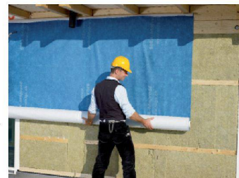
Siga Rüt mattstrasse 7 CH - 6017 Ruswill < www.siga.ch >

l'empêche de grésiller et, comparé à des produits conventionnels à une ou deux couches, il est peu bruyant. En outre, ouvert à la diffusion, Majvest empêche avec fiabilité l'accumulation d'eau de condensation ainsi que la formation de moisissure. Le nouvel écran pour façades, aux mensurations de 3 x 50 m d'une surface totale de 150 m 2 par rouleaux, est disponible dans le commerce spécialisé.