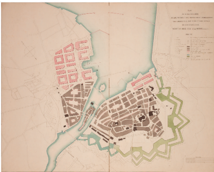
Fig. 3 : « Projet général de port », par Alexandre Rochat-Maury, 5 novembre 1854