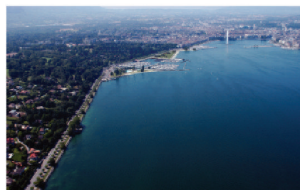
Photomontage de la grande rade avec le projet de port, plage et parc publics des Eaux-Vives