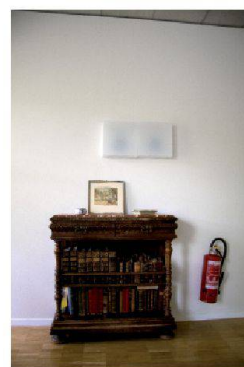
En Afrique, on dit qu'un vieux qui meurt, c'est une bibliothèque qui brûle. EMS de l'Orme II, tumeur