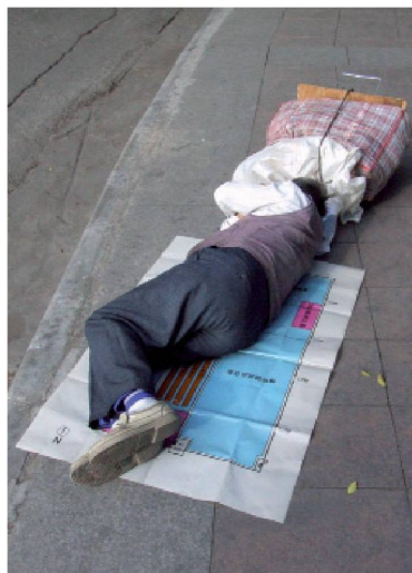
« Guangzhou Window Nr 9 », (Photo Charlie Koolhaas)

« Room for Thought ». Galerie Lucy Mackintosh, Av. des Acacias 7, Lausanne. Jusqu'au 27 novembre, ma-ve 14-19 h, sa 12-17 h. < www.lucymackintosh.ch >