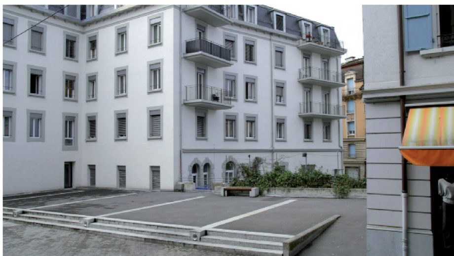
L'esplanade du Corso. Au fond à gauche, les locaux d'Espace TILT

Voir < www.espace-tilt.ch > et le mémento p. 28