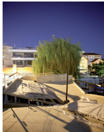
Vue nocturne du chantier de la place du Marché

Renens, politique de la ville Marianne Huguenin, Tinetta Maystre Propos recueillis par Francesco Della Casa