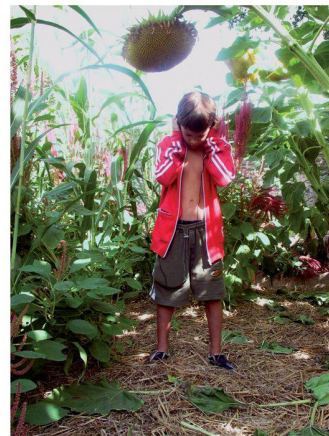
Les plantes à graines pour le domaine du Gaseau (F)

Propos recueillis par Daniela Dietsche et Clementine van Rooden