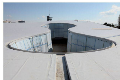
Pato du Rolex Learning Center