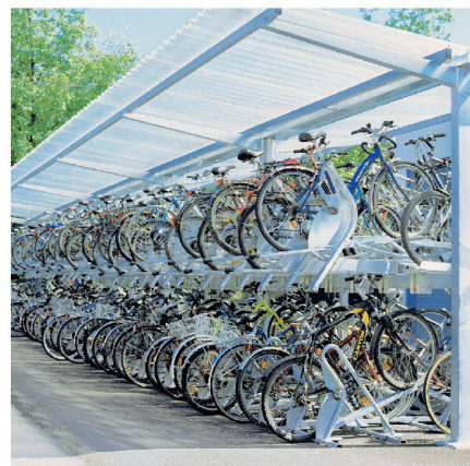
Des solutions intelligentes lorsque la place manque.

de façon optimale les abris et les installations de parc 2 roues autour des immeubles. En outre, Velopa s'est transformé depuis l'an 2000 de plus en plus en partenaire de fourniture pour marchés publics. De très nombreux parcs modernes de bicyclette dans les gares en sont le témoin. Grâce à des systèmes de produit bien étudiés, Velopa peut réaliser la plupart des souhaits des clients individuels en assemblant des pièces normalisées de conception modulaire. Cela rend les produits économiques et permet de courts délais de livraison.