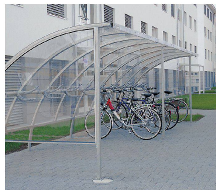
Élégante et filigrane: La couverture « Oméga ».

Entraîné par le développement du secteur bicyclettes et de la mobilité, Velopa a aussi des « cordes futuristes » à son arc. Nous évoquons ici en exemple les nouveaux systèmes d'accès ainsi que l'électro-vélo. En outre, l'entreprise rayonne entre-temps au niveau international. Velopa France a été constitué en 1997, et depuis avril 2009 la filiale « 1a-parken » est opérationnelle à Rheinfelden en Allemagne.