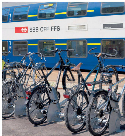
L'empreinte Velopa dans de nombreuses gares suisses.

Pour le développement de solutions individuelles, Velopa est l'interlocuteur pour planificateurs, architectes et maîtres d'ouvrage. « L'œil architectonique » bien développé des conseillers Velopa aide à réaliser le souci principal des donneurs d'ordre: ajuster