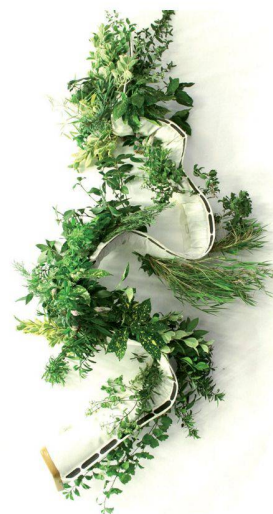
Projet « Electriflore », d'Alexandre Kourmowsky (ENSCI)