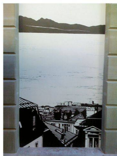
Trompe l'œil, Rue Agassiz 5 (Photos Eugène)