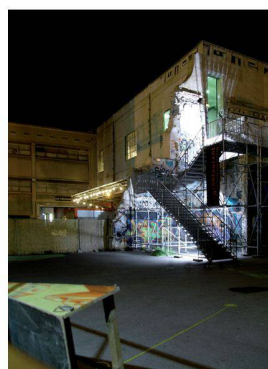
Friche de la Belle de Mai

Le Grand Paris et la société du spectacle Jean-Claude Garcias