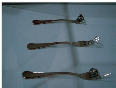
Des « Fourchettes parlantes » selon Munari

Editeur SEATU - SA des éditions des associations techniques universitaires / Verlags - AG der akademischen technischen Vereine Stafelstrasse 12 8045 Zurich Tél. 044 380 21 55 Fax 044 380 21 57 info@seatu.ch Katharina Schöber, directrice Hedi Knöpfel, assistante Régie des annonces - CH romande Künzler-Bachmann Medien AG Rue de Bassenges 4 1024 Ecublens Tél. 021 691 20 84 Fax 021 693 20 84 CH allemande Künzler-Bachmann Medien AG Gellenwillenstrasse 8a Case postale 1162 9001 Saint-Gall Tél. 071 226 92 92 Fax 071 226 92 93 Abonnement, vente au numéro Stämpfli Publikationen AG, R. Oehri, tél. 031 300 62 54 Vente en librairie Lausanne: BASTAL, f'ar, FNAC, La Fontaine (EPFL) Genève: Archigrahy Tarif (TVA 2.6 % comprise - N° de contribuable 249 619) Abonnement d'un an Fr. 180.- (Suisse) / Fr. 239.- (EU-USA-CAN) / Fr. 251.- (autres) Numéros isolés Fr. 12.- (port en sus)