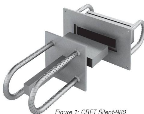
Figure 1: CRET Silent-980

En se basant sur les résultats des essais préliminaires, on s'est occupé de l'aspect des nouveaux éléments de transmission de charges. Les nouveaux matériaux d'isolation étant plus mous que le néoprène, il a fallu entre autres agrandir la surface d'appui, ce qui a conduit au nouveau design des éléments CRET® Silent-980, -981 et RIBA Silent-912, -914 (fig. 1).