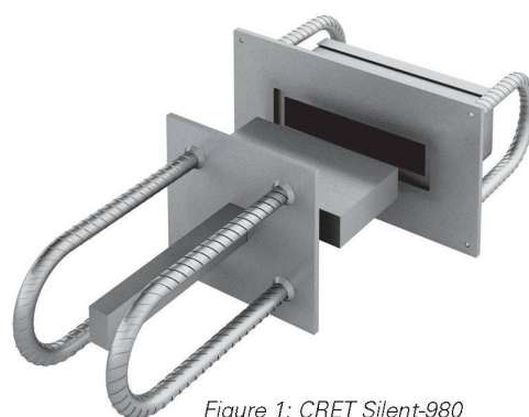
Figure 1: CRET Silent-980

En se basant sur les résultats des essais préliminaires, on s'est occupé de l'aspect des nouveaux éléments de transmission de charges. Les nouveaux matériaux d'isolation étant plus mous que le néoprène, il a fallu entre autres agrandir la surface d'appui, ce qui a conduit au nouveau design des éléments CRET® Silent-980, -981 et RIBA Silent-912, -914 (fig. 1).