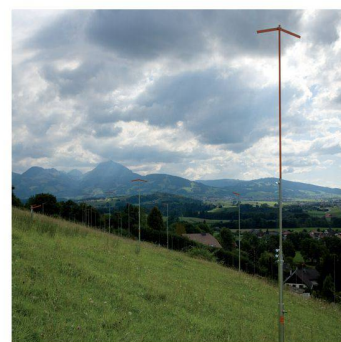
Gabarris à Corbières (FR)