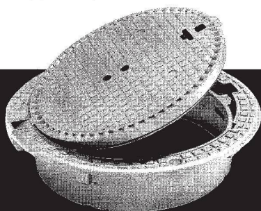
Classe D400, E600 et F900 avec ou sans verrouillage (ventilé ou non en D400 ).