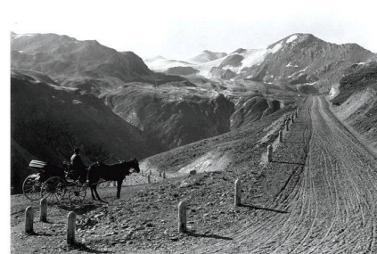
Route du Col de l'Umbral, GR