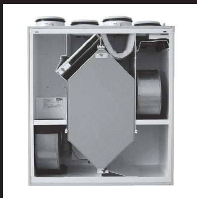
Système de ventilation avec récupération d'énergie