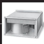
Ventilateurs centrifuges à action