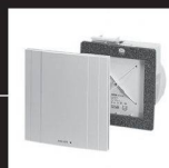
Système d'aération monogaine