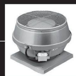
Ventilateurs de toits

30 Jahre Erfahrung Helios Ventilatoren AG Lufttechnik