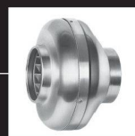
Ventilateurs pour gaines