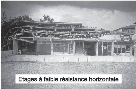
Etages à faible résistance horizontale