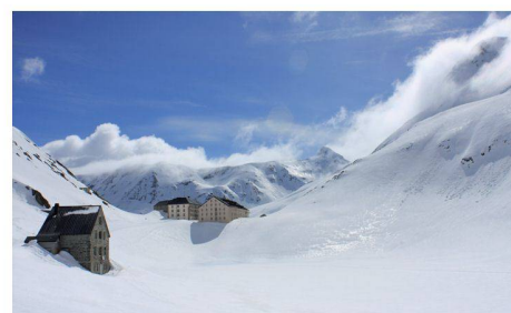
Col du Grand-Saint-Bernard depuis la frontière italienne

Retrouver la route du col du Grand-Saint-Bernard Yves Molk et Christian Hagin Le printemps des routes de montagne Jacques Perret