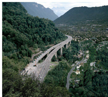
Autoroute A9, au-dessus de Chillon, NS à Evian, photomontage