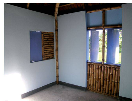
Construction vernaculaire avec ossature en bambou

Valider les savoirs ancestraux Caroline Dionne