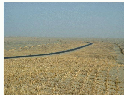
Autoroute du Taklamakan