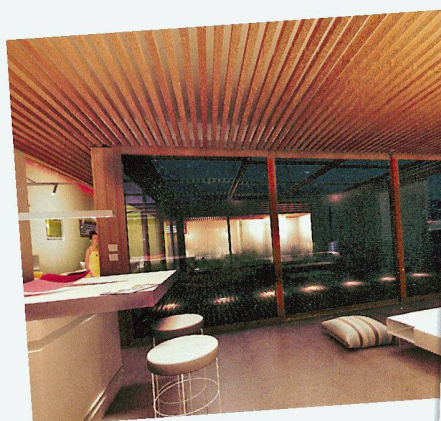
Vue plongeante sur le living depuis la cuisine.

Une maison, c'est l'aboutissement d'un rêve. Spécialiste suisse de la construction, notre groupe est là pour lui donner vie. Bois, parquets, carrelages, matériaux, salles de bains, cuisines, appareils ménagers et aménagements extérieurs, l'habitat est notre métier. Et une passion que nous exerçons depuis plus de 150 ans, toujours à l'affût des nouvelles tendances. Car la tradition n'empêche pas l'innovation. N'hésitez pas à nous confier vos projets, nous en ferons une belle maison. Rendez-vous dans nos expos.