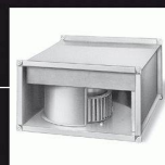
Ventilateurs centrifuges à action