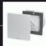
Système d'aération monogaine