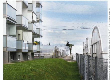
Paysage de périphérie

Nouveaux espaces publics : les projets d'Europan 9 en Suisse Francesco Della Casa