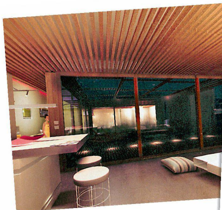
Vue plongeante sur le living depuis la cuisine.

Une maison, c'est l'aboutissement d'un rêve. Spécialiste suisse de la construction, notre groupe est là pour lui donner vie. Bois, parquets, carrelages, matériaux, salles de bains, cuisines, appareils ménagers et aménagements extérieurs, l'habitat est notre métier. Et une passion que nous exerçons depuis plus de 150 ans, toujours à l'affût des nouvelles tendances. Car la tradition n'empêche pas l'innovation. N'hésitez pas à nous confier vos projets, nous en ferons une belle maison. Rendez-vous dans nos expos.