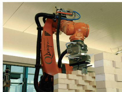
Robot maçon