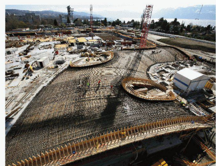
Le chantier du Rolex Learning Center

Conception des façades vitrées Pierre-Olivier Spagnol