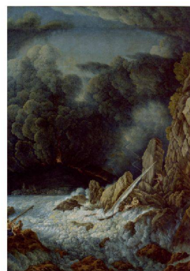
A.-L.-R. Ducros, «Eruption du Vésuve et naufrage»

Deux ouvrages récents de François Walter Bernard Debarbieux / Julien Grisel