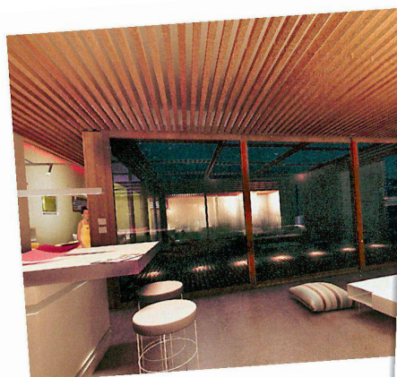
Vue plongeante sur le living depuis la cuisine.

Une maison, c'est l'aboutissement d'un rêve. Spécialiste suisse de la construction, notre groupe est là pour lui donner vie. Bois, parquets, carrelages, matériaux, salles de bains, cuisines, appareils ménagers et aménagements extérieurs, l'habitat est notre métier. Et une passion que nous exerçons depuis plus de 150 ans, toujours à l'affût des nouvelles tendances. Car la tradition n'empêche pas l'innovation. N'hésitez pas à nous confier vos projets, nous en ferons une belle maison. Rendez-vous dans nos expos.