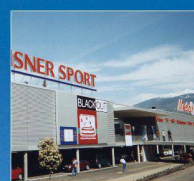
Media Markt, Conthey