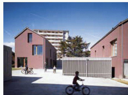
Groupes d'habitations de L'architectes à Chavannes