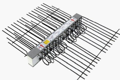
Nouveauté : Type HIT-BX-HV