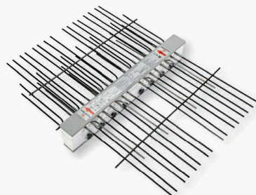
Nouveauté : Type HIT-BD