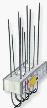
Nouveauté : Type HIT-AT

H ALFEN a élargi sa gamme de produits de consoles isolantes et vous présente ces nouveaux éléments HIT et bien davantage. Rendez-nous visite à la Swissbau 2007 afin de vous familiariser avec les nouvelles possibilités concernant les raccordements de balcons.