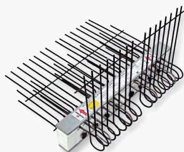
Nouveauté : Type HIT-BX-WO