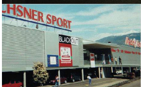
Media Markt, Conthey

Elsäßer fabrique avec une nouvelle installation de production. Votre avantage: une précision au plus haut niveau, production et vente d'une seule main - „just in time“. Profitez de nos éléments de grande taille.