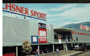
Media Markt, Conthey

Elsäßer fabrique avec une nouvelle installation de production. Votre avantage: une précision au plus haut niveau , production et vente d'une seule main - „just in time“. Profitez de nos éléments de grande taille .