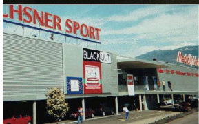
Media Markt, Conthey