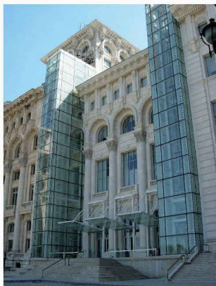
Musée National d'Art Contemporain, Bucarest