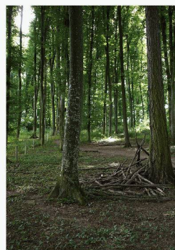
Sous-bois de feuillus