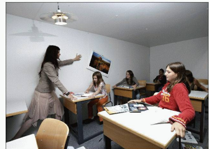
Le simulateur de séismes de l'OFEV

Sécurité sismique, aspects juridiques Walter Maffioletti