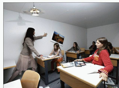
Le simulateur de séismes de l'OFEV