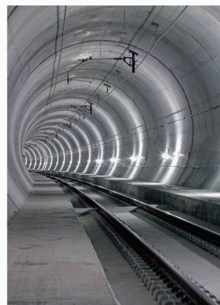
Tunnel de base du Lötschberg

Tester les installations de sécurité Roland Hofstetter, Patrick Favre, Michele Mossi