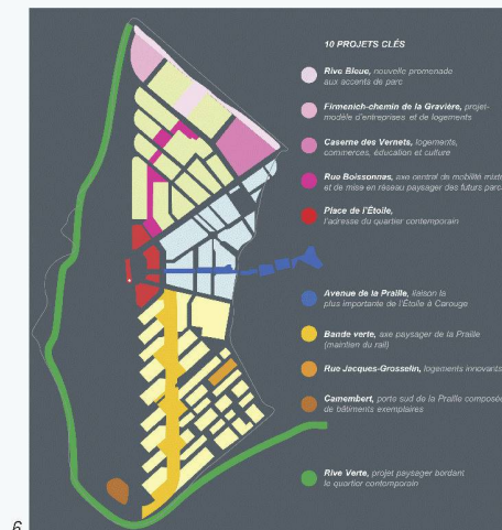
Fig. 1 : Périmètre du masterplan, avec le tracé de la liaison ferroviaire CEVA