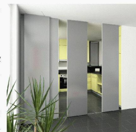
Hawa AG Untere Fischbachstrasse 4 CH-8932 Mettmenstetten info@hawa.ch < www.hawa.ch >

qu'à 250 kg. Le dernier-né issu du bouillonnement d'idées de Hawa est le système Hawa-Puro 100-150 , destiné aux portes coulissantes en verre. Il fera sa première apparition en Suisse à l'occasion du salon Swissbau et sera disponible dès le printemps prochain. Cet élégant système de ferrures au design épuré correspond à l'idéal de la ferrure invisible; en effet, le rail de roulement et sa suspension intégrée sont totalement encastrés dans le plafond.