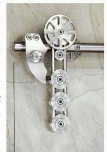
Beat Bucher AG Konstanzerstrasse 58 CH-8274 Tägerwilten < www.BucherWeb.ch >

Les surfaces coulissantes des ferrures MWE sont inusables - contrairement aux guidages en plastique, celles-ci sont totalement sans jeu et silencieuses. Ferrures de portes coulissantes en acier inoxydable et surfaces finement polies à la main offrent un excellent confort esthétique et fonctionnel. En outre, le stand présente diverses nouveautés de fermetures pour meubles et cuisines.