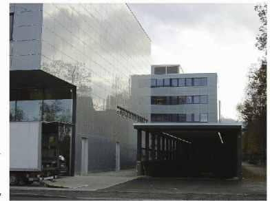
Saint-Gobain ISOVER SA Case Postale 11 CH-1522 Lucens

Minergie. Ris Confort est destiné à l'isolation thermique et phonique de cloisons sèches. Il se distingue par sa couleur marbrée gris-noir et par son revêtement en voile de verre doux comme de la soie qui améliore encore le confort de mise en œuvre. Isover Vario KM Duplex est un pare-vapeur adapté à effet d'assèchement. Sa résistance à la diffusion de vapeur d'eau s'adapte à l'humidité ambiante.