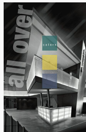
Eternit (Schweiz) AG CH-8867 Niederurnen < www.eternit.ch >

teintés dans la masse. Le stand d' Eternit (Schweiz) AG présentera en outre les produits les plus récents et de nombreuses nouveautés des domaines de la toiture, de la façade, de la construction intérieure et du jardin.