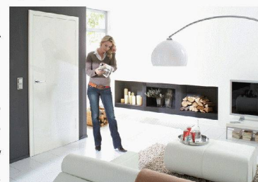
Herholz Suisse Parkstrasse 22 CH-5012 Schönenwerd < www.herholz.ch >

l'entreprise d' Ahau/D sera représentée par de nombreux collaborateurs, qui offriront des informations ciblées aux distributeurs et aux architectes. Dans une atmosphère évoquant un univers cinématographique décontracté, chacun pourra écrire les scripts de ses futurs succès sur le marché.