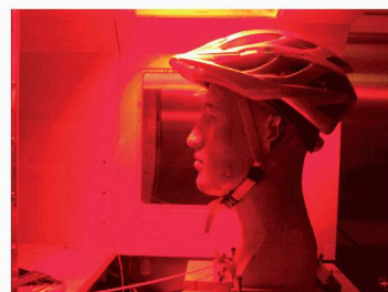
Modèle de tête avec casque de cycliste et simulation du rayonnement solaire par lampe infrarouge